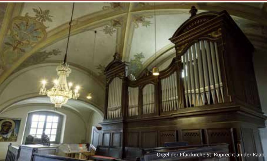
Orgel der Pfarrkirche St. Ruprecht an der Raab