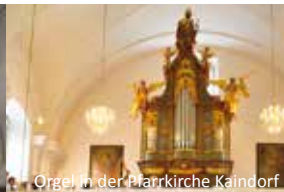
Orgel in der Pfarrkirche Kaindorf