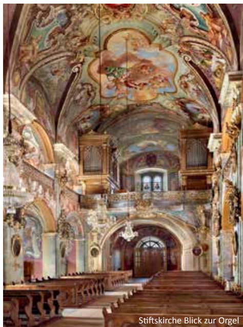
Stiftskirche Blick zur Orgel