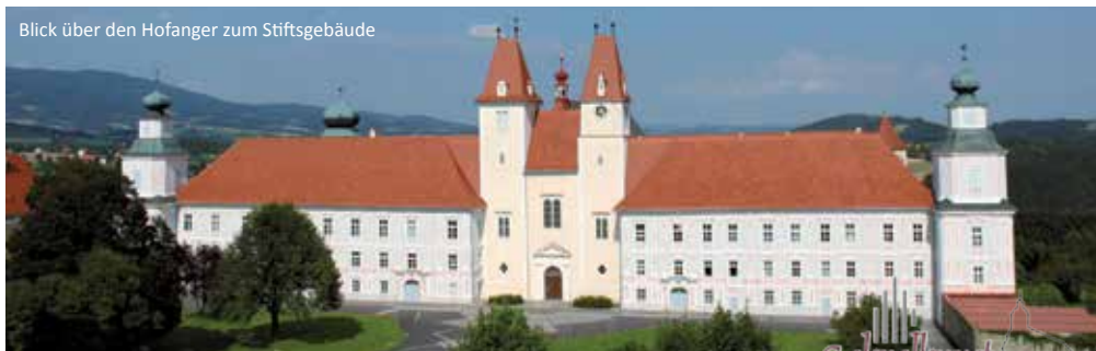
Blick über den Hofanger zum Stiftsgebäude

Die Stiftskirche entstand in der heutigen Form 1662 nach Plänen von Domenico Sciascia, der vorher auch die Basilika Mariazell erbauen konnte. Die vierjochige Wandpfeilerkirche mit Seitenkapellen und darüberlaufenden Emporen reichte allerdings nur bis zum Bereich des heutigen Volksaltars. Auf Intervention des berühmten Architekten Matthias Steinl wurde gegen Osten 1699 der Chorraum um eine geräumige Rundapsis erweitert. Erst jetzt war es möglich das große Raumkonzept des Matthias Steinl zu realisieren. Es besteht aus dem mächtigen Hochaltar, der von der Lichtführung der dahinterliegenden Fenster in seiner Wirkung noch gesteigert wird, aus der Kanzel im Langhaus und dem dazwischenliegenden Chorgestühl und den beiden Orgeln. Die Orgeln und das Chorgestühl wurden 1747 auf die Empore zwischen den Stiftstürmen übertragen, wo sich vorher die Prälaturkapelle befand.