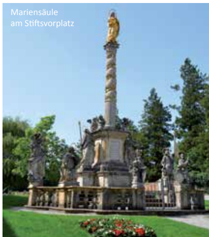
Mariensäule am Stiftsvorplatz